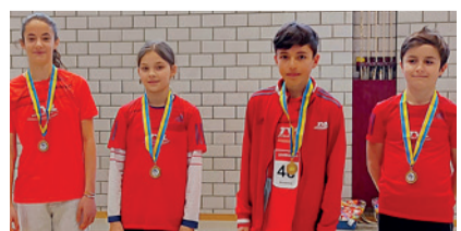
Bronze für das Schüler A-Team vom TV Lützelflüh Athletics.