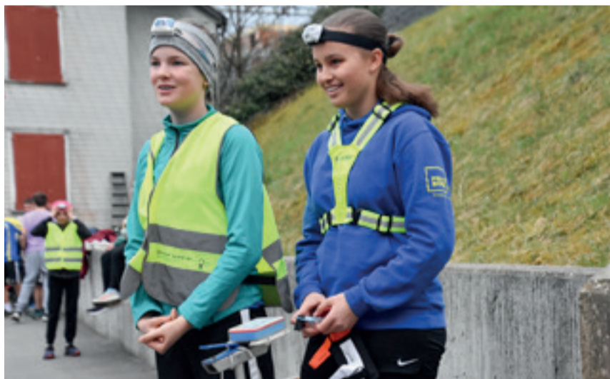
Ausgerüstet mit Stirnlampe und Leuchtweste ins Abenteuer «Städtli-OL».